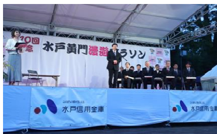
メイン会場：ステージ ※ダイヤモンドのみ対象