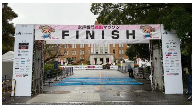
メイン会場：フィニッシュゲート