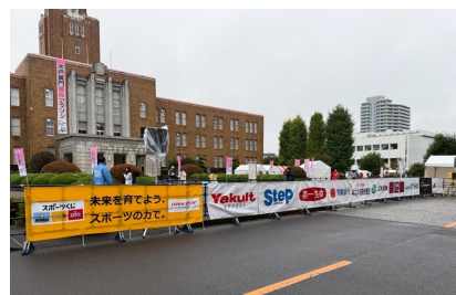
フィニッシュ会場