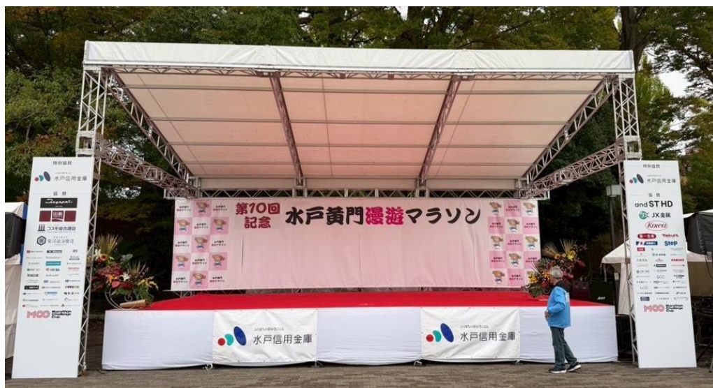
メイン会場ステージ