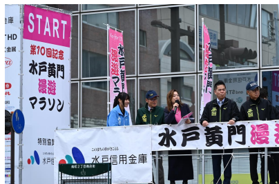
スタート会場：ステージ ※ダイヤモンドのみ対象