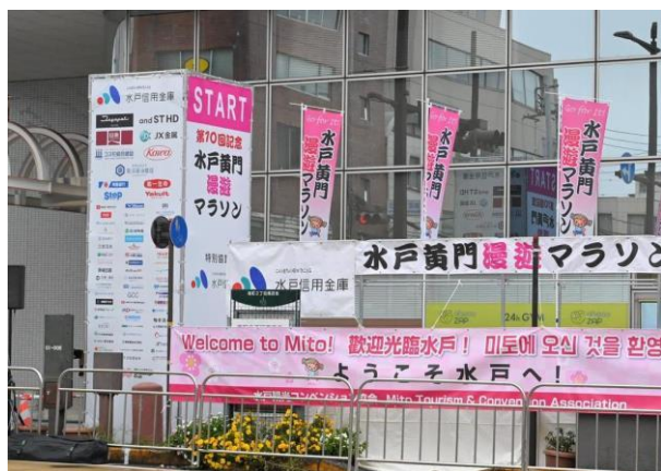
スタート会場：スタートゲート

◇スタートゲート・フィニッシュゲート及びメイン会場のステージに 貴社ロゴ等を掲載します。